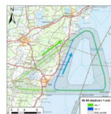
Figur 1 Övningar med SK 60 flygs både över land och vatten.

Totalt kommer övningarna årligen att innebära 2150 passager över målet. 37 De totalt 50 övningsdagarna om året kommer, enligt ansökan, främst att ske dagtid på vardagar men ibland även under kvällar. 38 Under juni-augusti samt då Vättern är isbelagd är det övningsuppehåll. 39