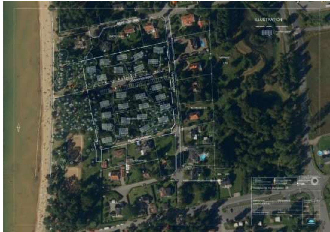
Illustration där detaljplan Badgästen är kombinerad med flygbild (ortofoto) med hjälp av GIS (egen illustration).

I detaljplaneförslaget Tvättsvampen föreslås område 8 i naturvärdesinventeringen sparas som naturmark, men övriga områden 5-7 (området kring långgolven) kommer att exploateras utan någon annan hänsyn än marklov för trädfällning av grova ekar och tallar. I område 6 finns ett flertal grova alar, lönnar och almar, som helt saknar skydd i den föreslagna planen. För att bevara dessa höga trädvärden måste hela området 6 bevaras som naturmark.