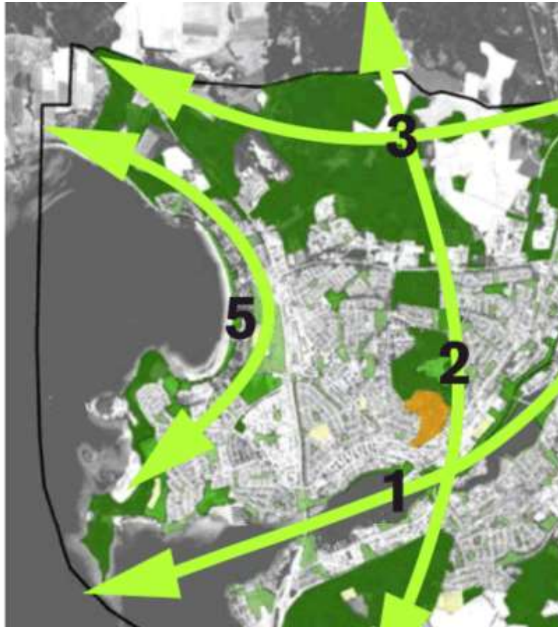
Figur 1: (del av figur från Grönstrukturanalysen, sid 11). Nr 5 illustrerar blå-gröna strukturen längs Vätterns stränder utmed Varamoviken.

MKBn anger att strategin för Varamo-området är att den blå-gröna strukturen längs med Vätterns strand ska utvecklas. Här är ytterligare ett starkt skäl till att den geografiska avgränsningen kan anses vara för snäv och bör omspänna hela Varamoviken. Även i stort sett samtliga riksintressen som redogörs för området omfattar hela Varamoviken.