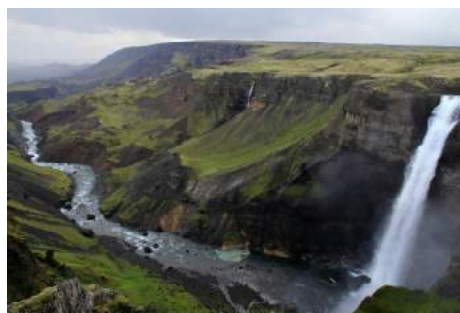
Haifoss, Island

Aktiviteten görs i samarbete med Motala Biologiska Förening, Naturskyddsföreningen Motala, STF Folkunga och Studieförbundet