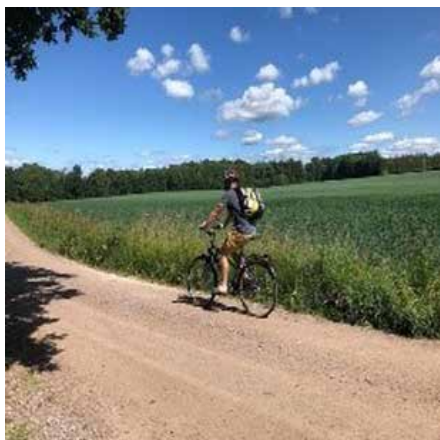
Tätortsnära åkermark vid Kårsby gård.

Naturskyddsföreningen i Motala har genomfört en förstudie av Motalas natur- och kulturlandskap, för att utreda om det uppfyller kraven för biosfärområde enligt FN-organet UNESCOs definition.