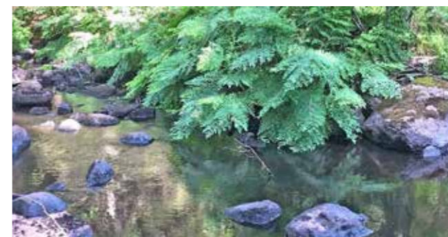
Ormbunken Safsa vid Ringarhultsån