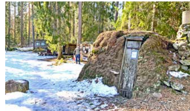
Kolarkoja vid Fågelmossen

Norr om Borens odlingslandskap växte en mosaik av mindre jord- och skogsbruk och bruksmiljö fram. Landskapets huvudsakliga påverkan av människan är här skogsbruket. Norr härom utvecklades en bergslag under tidiga medeltiden. Verksamhet med gruvor och järnhantering i norr har påverkat bygden längre söderut med den bruksmiljö som vuxit fram.