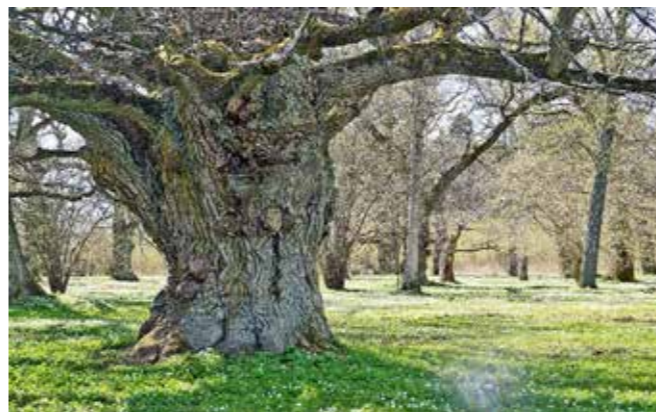
Ekhage vid Kristberg kyrka