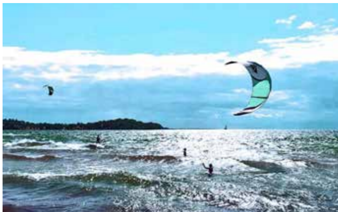
Bad och surfing i Varamon

Fyren på ön Fjuk har varit viktig för den betydande sjöfart som länkat samman landskapen runt sjön. Vättern är utifrån geologiska termer en gravsänka som bildades för ca 600 miljoner år sedan. Vätterns mångfald av arter och dess värdefulla rena och klara dricksvatten ger sjön ett extremt högt skyddsvärde.