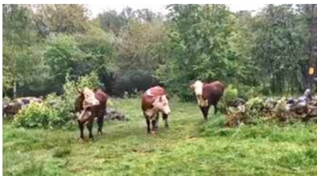
Betesdjur på Soldatängen i Motala

Förutom en vacker och omväxlande natur, har landskapet påverkats av en enastående intressant kulturhistoria som ännu är närvarande och stora områden är fortfarande lågt exploaterade.